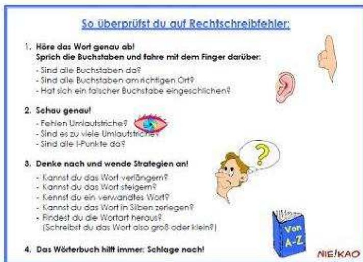
Tippkarte und Laufzettel

Habe ich alle Buchstaben? Habe ich sie in der richtigen Reihenfolge? Ist irgendwo eine Dehnung, die markiert werden müsste? Ist der Laut weich oder hart?